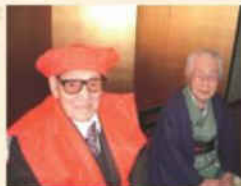
百歳お祝いにて奥さんと