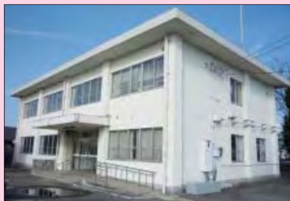
町保健福祉センター（旧保健所跡地）

場 所 町保健福祉センター（旧保健所跡地） 住 所 会津坂下町字西南町裏甲 3998-1 委託事業所 NPO 法人 真桜会 桜の家 電話番号 0242-84-3030 FAX番号 0242-84-3033