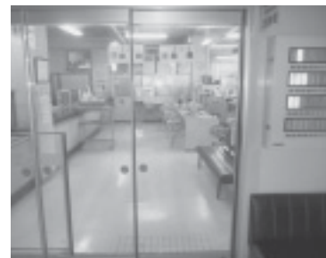
税務管理班側入口