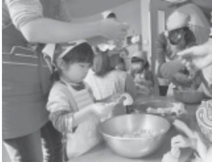
キャベツを手でちぎっています

子どもは何でも自分でやってみたいと思うもの。おうちの方が料理を楽しく作ってあげれば、やりたいという気持ちが芽生えていきます。それが食べ物や食べることへの興味を広げます。将来的には、自分で必要な食べ物を選び、調理することが当たり前になり、自分の生活を成り立たせていく、つまり生きる力を育てていきます。