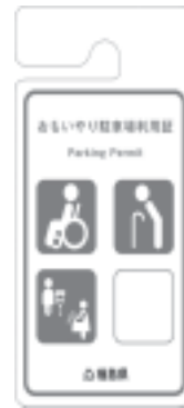
おもいやり駐車場利用証