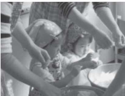
ママといっしょで楽しいな!!

子どもの成長にあわせて料理にかかわる体験も増やしていきましょう。野菜を洗ったり、味見をしたりすることで、「どんな料理ができるんだろう」「おいしそうだな」と自然と食事を楽しみにするはず。自分が作った物というだけで、いつも食べられなかったものを食べるきっかけになるでしょう。