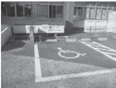
おもいやり駐車場