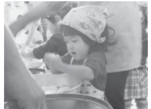
わたしにもできるんだよ～♪

はじめは、一緒にお買い物に行くだけでもよいでしょう。そこで、「にんじん」「じゃがいも」など食べ物の名前や形を覚えたり、「どれにする？」と子どもにどの食材が良いか選んでもらうのもよいでしょう。また、お店の人とお家の人のやり取りを子どもはじっと見ている。子どもの社会性や人間性の育成にも役立っていくことでしょう。