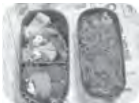
2年生女子のお弁当

自分で献立を考え、おうちの人と一緒に材料を準備し、前日に仕込みをしたり、がんばって早起きして、一人ひとりの工夫が光る素敵なお弁当の出来上がり！お昼の時間には、学年間の交流をしながら、楽しくいただきました。