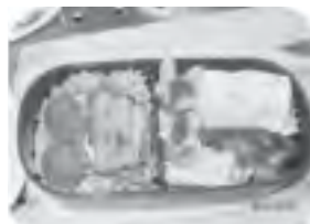
5年生男子のお弁当