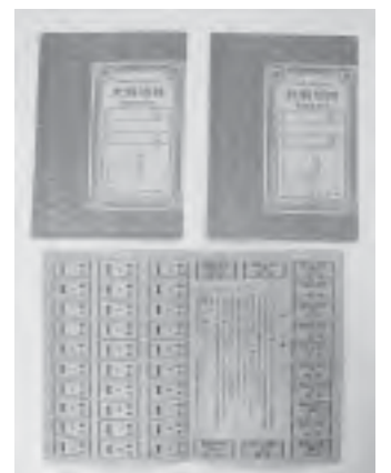
衣料切符 (長谷川勝家文書)