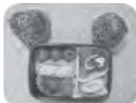
3年生男子のお弁当