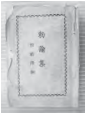
勅諭集 附戦陣訓 (齋藤与志夫家文書)