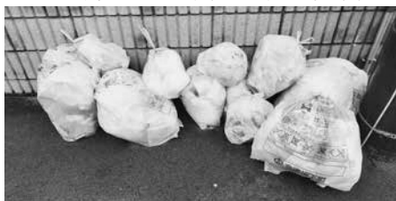
なかなか減らないゴミの量！

答 現在、各団体による資源回収への報奨金を令和2年度には1kgあたり前年より1円増加の5円を交付しております。また、コンポスト、EMバケツ、電動式生ごみ処理機などに補助金を交付しております。各種リサイクルは本年度、小型家電・古着類、金属製品などの回収を実施しました。町民の方々への啓発事業として高齢者サロンや小学校への出前講座や、町ホームページや広報等を利用して、ごみの減量化・再資源化について広く町民の方々に推進してまいります。