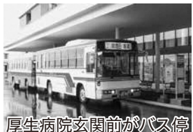
厚生病院玄関前がバス停

12月1日より若松・坂下線ではバスを乗車利用すると「道の駅あいづ」で使用できる割引券をもらい、割引利用を受けられます。新厚生病院でもバス利用者は、病院内のコンビニでの同様の取り組みを考えています。