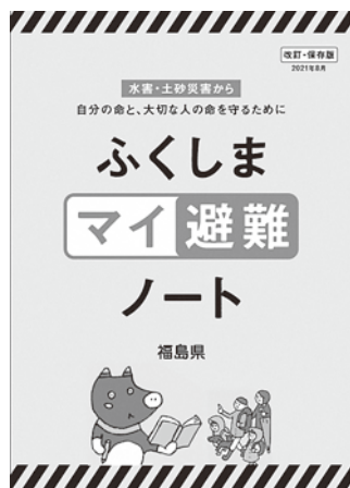
日頃から目のつくところに置きましょう。

答 効果的なボランティア活動が行われるために、災害対策本部の中にボランティア活動に関する情報提供の窓口を設置し、災害に関してどの分野でどのようなニーズがあるのか、またどのような専門的知識、技能を持ったボランティアがいるかを把握し、社会福祉協議会や赤十字奉仕団などのボランティア団体と連携し、情報提供共有しながら、受入体制の整備に対応してまいります。