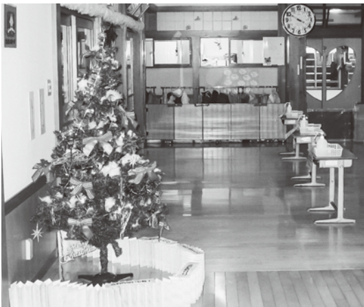
ばんげ保育所のクリスマスツリー飾り付け

問 子育て支援の全般から見た保育料の改定の持つ意味は何か。子育て支援全体を見ることがおろそかではないか。