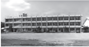
平成20年 川西小学校

明治六年(一八七三)に、最初の小学校が笹屋敷(八日沢)に設立された時に、学校名を「弘毅学校」とした。