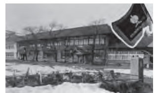
昭和36年頃 川西小学校

その年は一斉に、他地区でも小学校が設立されるが、村名を付けていた。このことから、同地区の教育への並々ならぬ意気込みが伝わってくるのである。