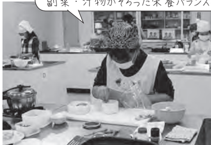
小学校上学年の部

上位6名により二次審査会を実施。40分て手際よく調理し、主食・主菜・副菜・汁物がそろった栄養バランスのよい朝ごはんが出来上がりました。