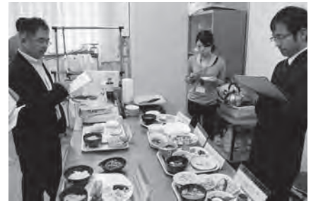
朝ごはんの彩りや味、材料の組み合わせを審査する審査員