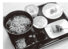
限定山菜かけそばセット(1,350円→1,000円)

■温泉利用券の有効期限は12月29日(水)までとなっています。 お早目にご利用ください。