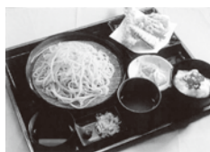
限定ザルそばセット (1,350円→1,000円)