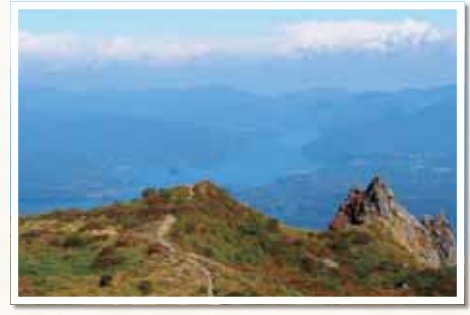
▲山頂から見下ろす絶景