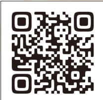
▲山頂での奉納の様子はこちらからご覧ください。