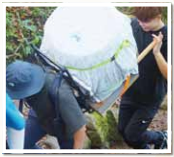
▲太鼓を担いで磐梯山頂を目指す