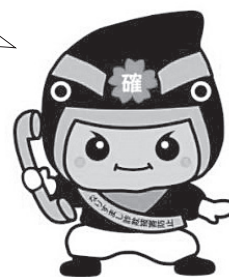
カクニンジャー福くん

警察官や金融機関職員を装い、キャッシュカードが悪用されているなどの電話の後に自宅を訪れた犯人が隙を見てキャッシュカードを盗むもの