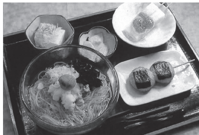
冷やかけそばセット (1250円分)