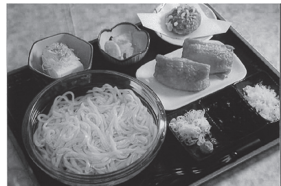
稲庭風冷やしかけうどんセット (1300円分)