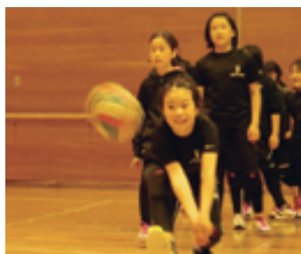
▲ボールがくるよ～ レシーブできるかな？