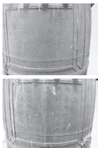
宇内・浄運寺銅鐘 享保十年(1735年) 早山掃部助次作