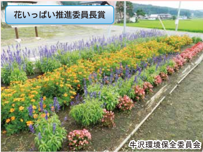
牛沢環境保全委員会