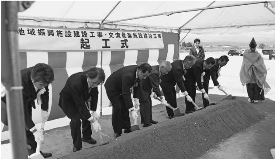
起工式 鍬入れの様子

「人の駅・川の駅・道の駅」の中核施設である「地域振興施設・交流促進施設」の建設工事安全祈願祭・起工式が平成25年8月27日に建設予定地において、発注者である湯川村及び会津坂下町の関係者のほか、国及び県関係者、近隣行政区長などの来賓が出席し、執り行われました。