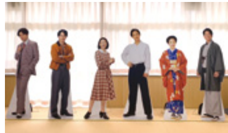
▲登場人物の等身大パネル