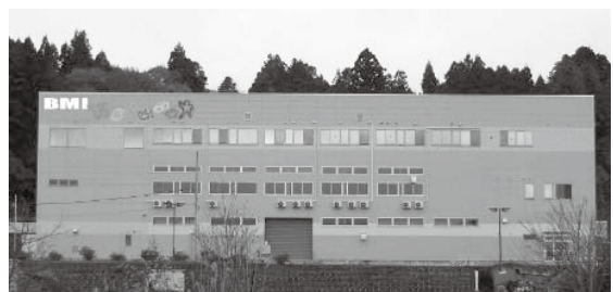
当社 坂下事業所マテリアルリサイクル(中間処理)施設