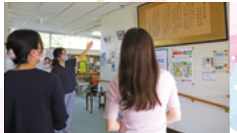
▲センター入口では校歌の歌詞を観ながら曲を聴くことができました。