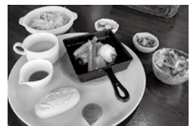
▲「くべえるセット」 サラダ・ドリンクバー付き 1,400円

その中でも、道の駅イチオシの「くべえるセット」は濃厚な味わいの「ビーフシチュー」に加え、「秋野菜とベーコンの味噌クリームパスタ」、「自家製パンと季節のフルーツジャム添え」など絶品メニューが一度にお楽しみいただけます！