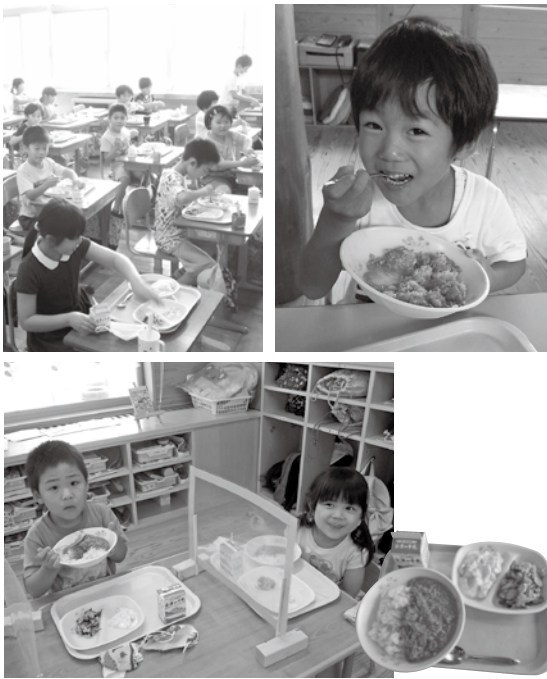
▶北本トマトカレーをほおぼる子どもたち (左…南小学校、右…東幼稚園、下…南幼稚園)

9月10日、姉妹都市の北本市の名物「北本トマトカレー」が昨年に引き続き再び給食メニューとして登場しました。今年は北本市よりいただいたレシピと、取り寄せたカレールーやガラムマサラなどの香辛料により、味も見た目も忠実に再現されました。トマトのやさしい酸味が溶け込んだカレーの美味しさに、子どもたちからは笑顔がこぼれました。