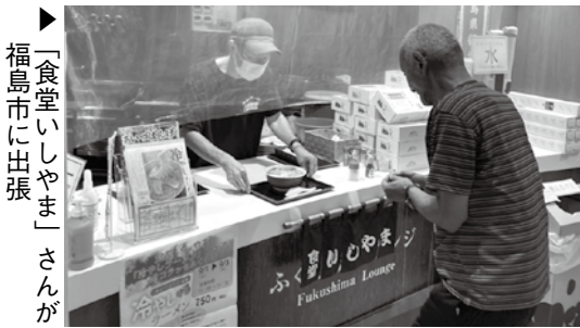
▶「食堂いしやま」さんが 福島市に出張

9月1日～3日にかけて、福島市の「コラッセふくしま」にて「会津坂下町冷やしラーメンフェア」を開催しました！新型コロナウイルス感染症対策として座席の制限などを行ったうえでの開催となりましたが、多くの方にご来場いただきました。冷やしラーメンのチラシも好評で、町内の提供店の多さに皆さん驚かされていました。