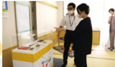
▲ドラマ中に主人公が吹いていた実物のハーモニカや、本などの小道具が楽しめました。