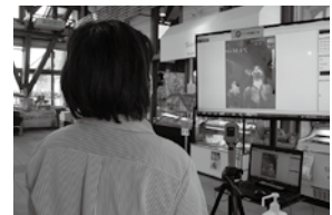
▲サーモグラフィで自動検温

道の駅あいづでは、施設入口での検温・アルコール消毒などを徹底しています。お客さまの安全を最優先に営業していますので、安心してお越しください。