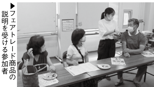
▶フェアトレード商品の 説明を受ける参加者

8月30日、会津坂下町国際交流協会が主催し、フェアトレードミニ講座が行われました。参加された11名の方は、フェアトレードについての説明を受けた後、フェアトレード認証商品を実際に飲食しました。参加者の方は「こんなに認証商品があるとは知らなかったのが勉強になった。買い物の際にはぜひ選ぶようにしたい。」などと話されました。