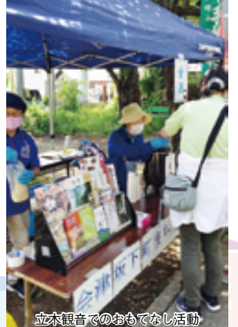
立木観音でのおもてなし活動