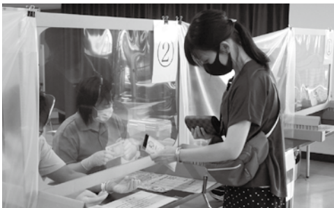
▶感染症対策を徹底した上で販売されました (中央公民館)

8月7日、今年1回目の軽トラタ市が開催されました。新鮮な夏野菜や旬の桃、お惣菜などを買求める仕事帰りのお客さんなどで賑わいました。軽トラタ市は毎年、ばんげ軽トラ市実行委員会により開催され、農家の方の採りたて野菜や果物の他、パンや惣菜などが並びます。今後は8月28日(金)、9月14日(月)に会津よつば農協職員駐車場にて開催予定です。