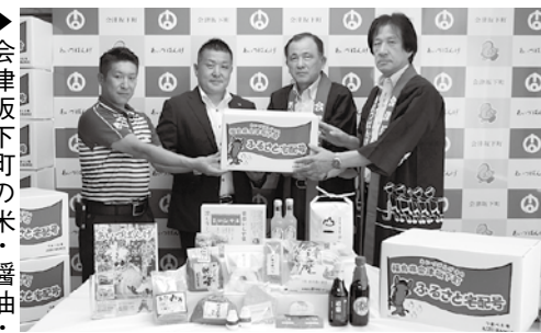
▶会津坂下町の米・醤油・味噌・冷やしラーメン・りんごや桃の加工品の詰め合わせをお届けします！