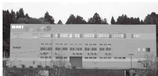
当社 坂下事業所マテリアルリサイクル(中間処理)施設