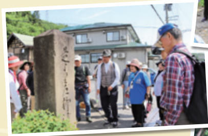
▲追分の碑文 旧沼田・越後・下野街道の分岐点