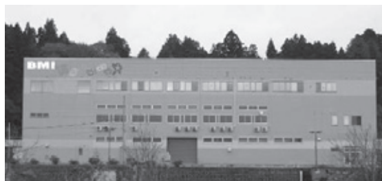
※2017年12月に坂下事業所(中間処理施設)を開設