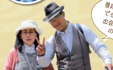
県外から参加のまち歩きファン