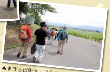
▲まほろば街道より会津盆地を望む