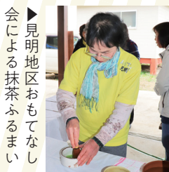
▶見明地区おもてなし会による抹茶ふるまい