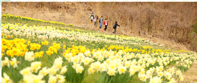
▲下山完了。見明地区の皆さんが植えた一面のスイセンがお迎え。

「広報あいづばんげ」へのご意見・ご感想お待ちしております!「今月のここが良かった・悪かった・もっとこうしてもらいたい」など、どんなことでも構いません。お気軽にお寄せください! 会津坂下町ホームページ URL https://www.town.aizubange.fukushima.jp E-mail jyouthou@town.aizubange.fukushima.jp