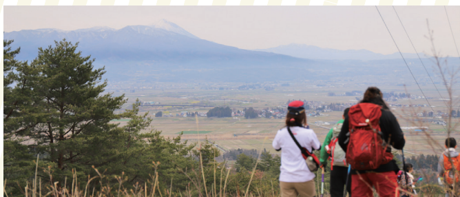
▲会津平野と磐梯山の雄大な景色を眺めながら帰途に着く。