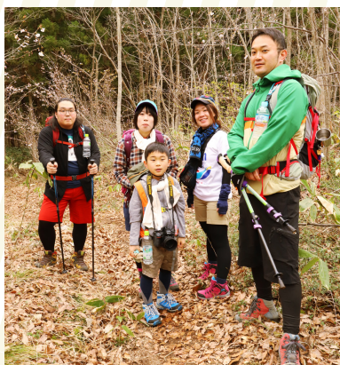
▲家族・友人のパーティーで参加