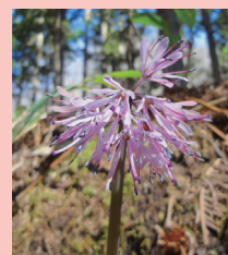
▲ショウジョウバカマ