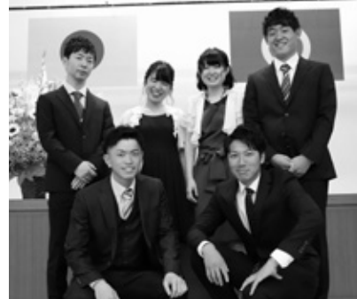
平成30年度の成人式実行委員の皆さん

■申込： 下記まで電話で申し込み 問 教育課 社会文化班 (中央公民館内) ☎83-3010