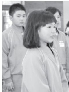
▲「税金の大切さが分かりました。」と、授業の感想を述べる坂下東小学校児童。

また、お金の重さを体験してもらおうと、児童に1億円のレプリカを持ってもらいました。小学校の体育館を建てるには、1億円以上のお金が必要だと説明すると、児童から驚きの声があがりました。