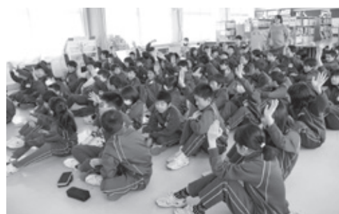
▲坂下南小学校の租税教室の様子。クイズを行い、分かりやすく授業を行った。