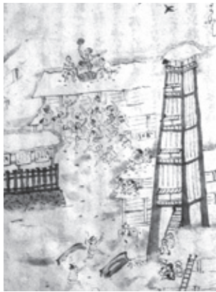
徒町百首俗解 (会津若松市発行「会津の年中行事」)

「徒町百首俗解」(明治二十九年 (一八九六刊))は、若松で行われる 行事を挿絵も据えて狂歌にしたもの で、大町で行われていた初市の様子 も描かれています。米俵引き(現 在の俵引き)の記載もありますが、 この時にはすでに廃されていて惜し い行事だったと書いています。