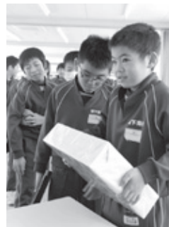
▲1億円のレプリカを持つ坂下南小学校の児童。重さは約10kg。「重いーっ！」