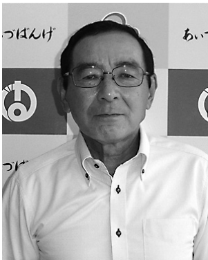
関本コミュニティセンター長