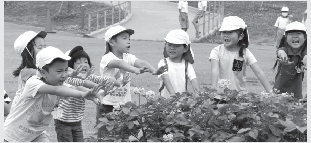
▲じゃがいも、さつまいも、大きくなあれ!!