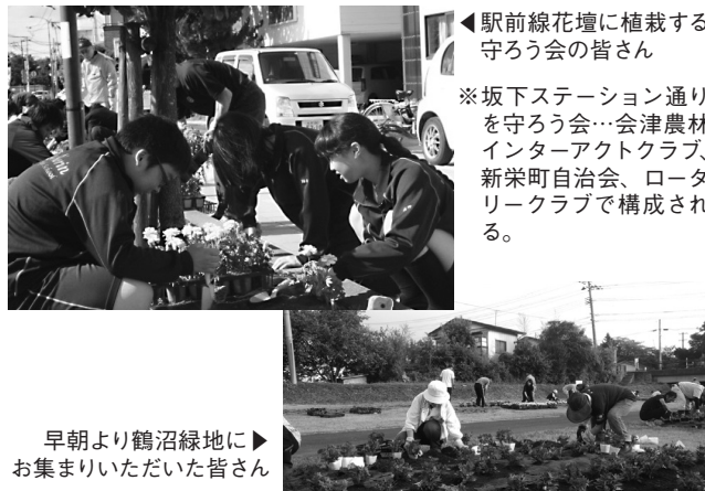
◀ 駅前線花壇に植栽する 守ろう会の皆さん

※ 坂下ステーション通りを守ろう会…会津農林 インターアクトクラブ、 新栄町自治会、ロータリー クラブで構成される。