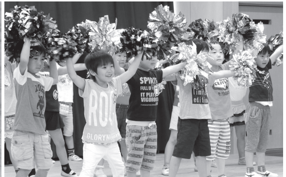
一生懸命に踊りを披露する園児たち