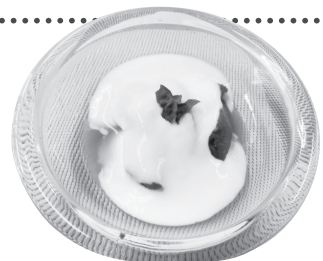
[1人分エネルギー：約60kcal]