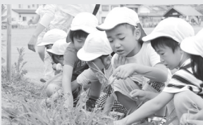
▲みんなでやれば早いね。

帰り際に子どもたちは「大きくなあれ!!」と野菜に声をかけ、草むしりは終了しました。