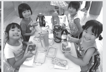
▲育てた野菜が入ったカレー

東幼稚園では、食への感謝を子どもたちに伝え続けるため、今後もみんなでおいしい野菜を栽培していきます。