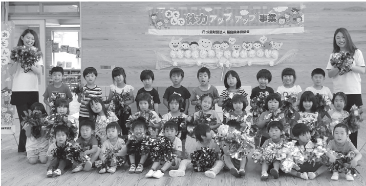
福島ファイヤーボンズチアダンススクールの皆さんと記念撮影