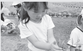
▲沢山の雑草を抜いたよ!