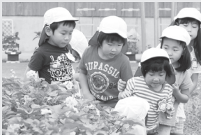
▲「みんなで雑草を抜きましょう!!」 ▲「大きな草が生えてる!」「どれどれ?」

畑には子どもたちが4月から苗を育て植えたじゃがいも、さつまいも、そらまめがあり、じゃがいもは薄むらさきの花を咲かせていました。