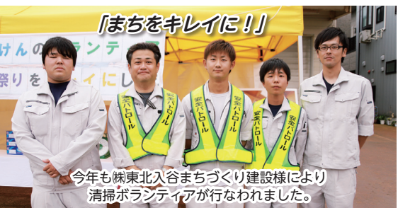
今年も㈱東北入谷まちづくり建設様により 清掃ボランティアが行なわれました。