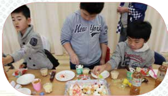
2月28日に行われたキッズ雛祭りイベント (お菓子作り) ▲とサキソフンの演奏▼