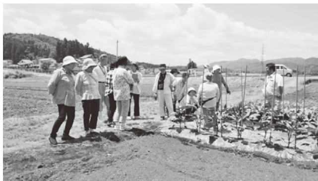
指導員による「現地指導会」の様子

また、今年度は6月に、おいしい野菜を提供するために、県の指導員・JAの指導員による会員の畑での現地指導会を開催しました。肥料や病害虫の予防・防除など質問を繰り返し積極的に学びました。来年度も活発に活動し、もっともっとおいしい野菜を子どもたちに届けたいと思います。