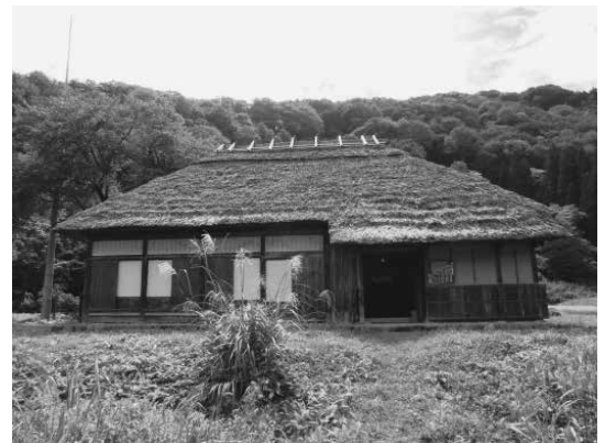
只見町旧五十嵐家住宅（現在地：叶津）