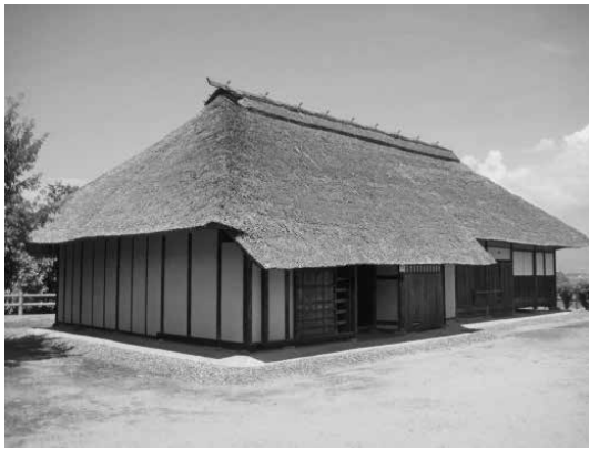
会津坂下町旧五十嵐家住宅（現在地：塔寺）

只見町・旧五十嵐家住宅は元文元年（一七三六）など幾度か改修した記録があり、初めは直屋造りで建てられていたのが、中門造りに変更さ