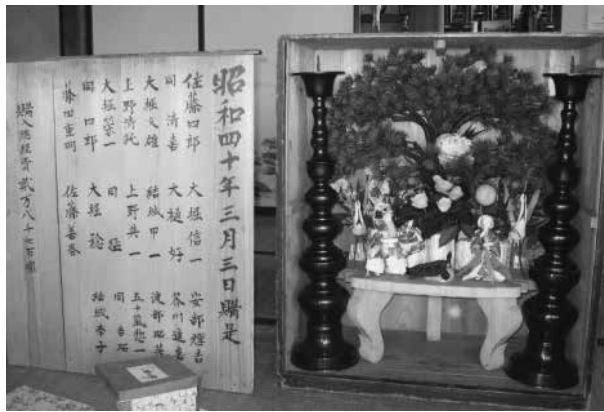
中開津有志一同より町に寄贈となった 婚礼用具【島台と燭台】

われていたようです。このたび、中開津の有志の方々二十人が昭和四十年三月に共同で購入した「島台」と「燭台二対」を寄贈していただきました。