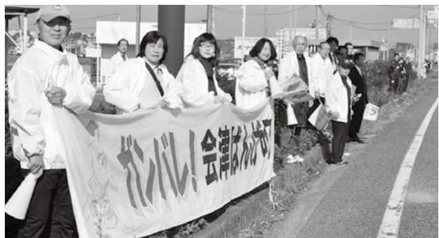
(昨年度の応援風景)