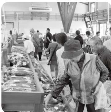
開所初日、多くのお客さまでにぎわう

の駅をはじめとした施設がもつポテンシャルが如何なく発揮され、さらなる交流の拡大、産業の振興につながるよう関係者一丸となって取り組んで参る」と式辞を述べました。また共同事業者である木我茂東北地方整備局道路部道路情報管理官、入江靖北陸地方整備局河川部長よりあいさつがありました。続いて村田文雄福島県副知事、菅家一郎衆議院議員、小熊慎司衆議院