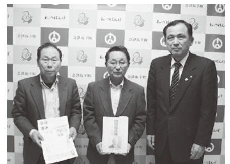
山川健次郎顕彰会 様 「評伝 山川健次郎 士君子の肖像」 町民の方に広く知っていただきたい