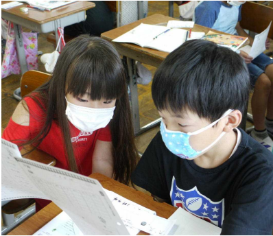
すてきに育てたい…

正直にお伝えすると、私にしんのすけの言葉が刺さるのは、きっと「大人の都合」を子ども達に押しつけた罪の意識があるからです。きっと、保護者の皆さんの方が子ども達に誠実に向き合っていると思います。お言葉をいただいて、ちょっと気恥ずかしい思いでした。