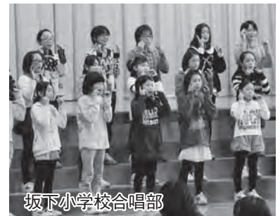
坂下小学校合唱部