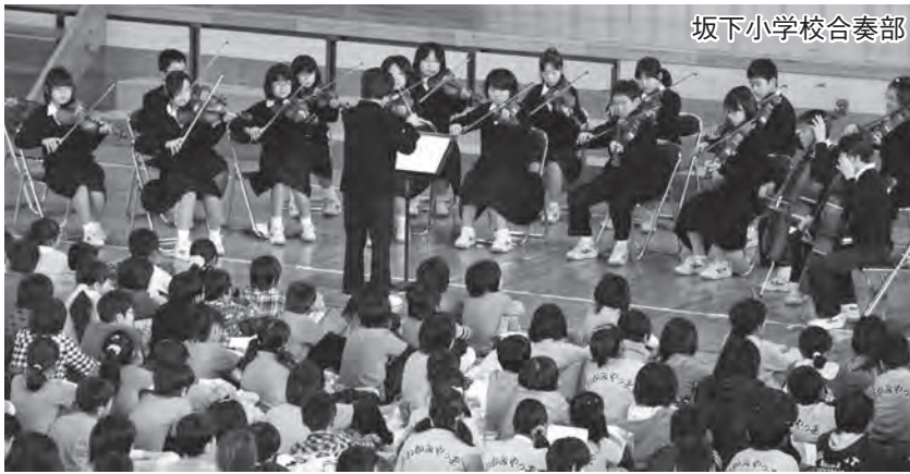
坂下小学校合奏部