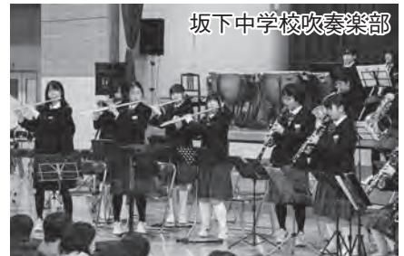
坂下中学校吹奏楽部