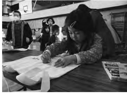
将来の名デザイナーを目指してエコバッグづくり