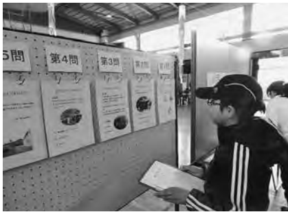
100点満点！！ ばんげクイズに挑戦！