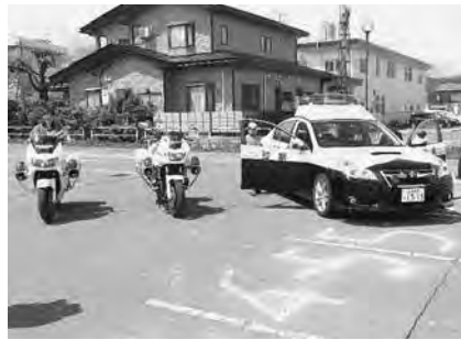
白バイ・パトカーによる 交通安全教室