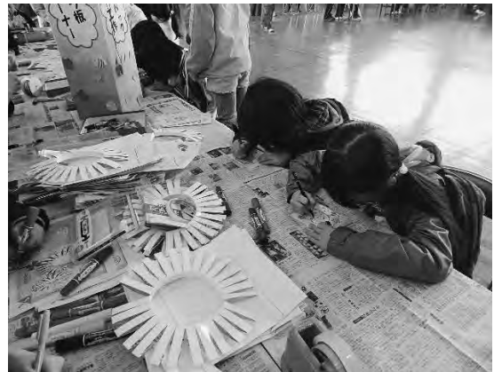
牛乳パックで 空飛ぶフーメラン工作