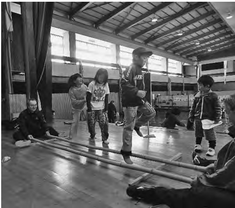
バンブーダンス体験 リズムに合わせて♪