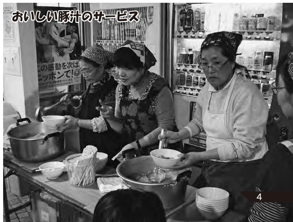
おいしい豚汁のサービス