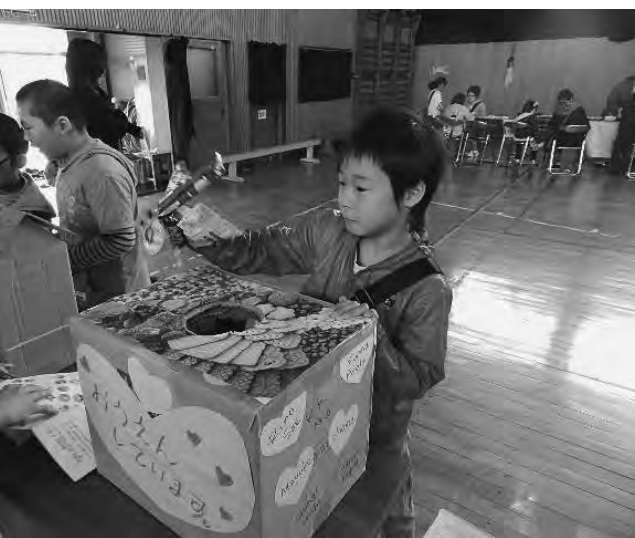
お菓子のつかみ取り いっぱい取れたかな？