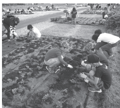
▲鶴沼緑地公園植栽 7/7

各種団体240名の皆さんにより植栽が行われました。鶴沼緑地公園では朝6時から200名の皆さんが約4,400本のサルビアやマリーゴールドの苗の植栽を、また、駅前線東側花壇では会津農林高校生や近隣自治会40名の皆さんによりマリーゴールドの苗約800本の植栽が行われました。