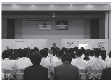
▲就職を希望する高校生など81名が参加

6月13日、会津坂下町雇用促進協議会は町内に事業所を持つ16企業を迎え、会津管内の高校生・高専生を対象とした合