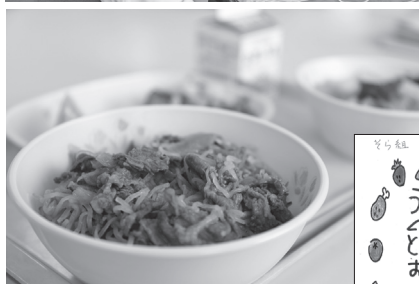
▶肉の風味豊かな牛丼