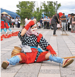
ひょっここ・おかめ

にかつての踊り手が見つかると、今年一月、二名の高齢女性に踊りを見せていただき舞を完成させることができました。 生徒の熱意がいくつもの奇跡をたぐりよせ、約七〇年ぶりに幻の舞「扇舞」を復活させたのです。