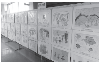
▲坂下南・坂下東幼稚園(年長)の絵画展示