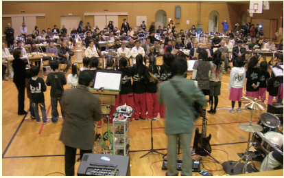
平成24年3月11日 絆交流会(川西体育館)

大震災から1年後に開催され、両町村の出席者は再会を喜びあいました。この時、葛尾村から感謝の碑を寄贈されました。