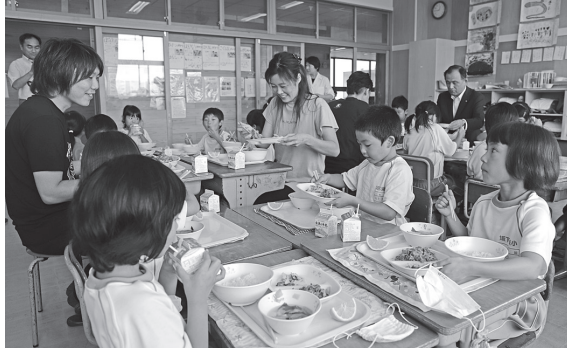
▶生産者田部畜産の方を 囲んでの給食

7月12日、田部畜産様（天屋）より町内と湯川村の幼稚園、小中学校の給食材料として黒毛和牛96kgをご提供いただきました。田部畜産様は「子どもたちに安全で美味しい地元の牛肉をぜひ食べてほしい。来年も続けたいです。」と話されました。牛肉は牛丼に調理され、生産者の方々と一緒に美味しくいただきました。