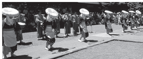
▲佐布川の早乙女踊り(会津美里町)