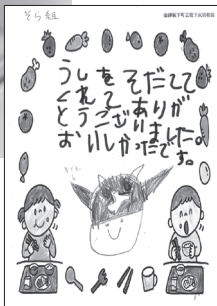
子どもたちからの感謝の手紙▶