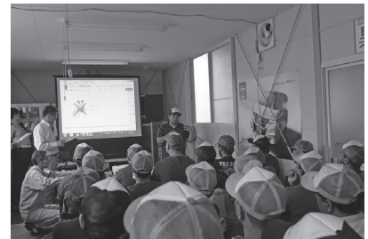
▲約140名の外国人就労者が参加。 (説明者：会津坂下警察署、会津坂下消防署、町)

八洲ゴム工業(株)の外国人就労者を対象に、防犯対策・火災や病気などの緊急時対処・ごみ出しのルール