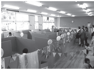
▲大勢の家族連れで賑わったダンボール迷路

6月16日、子育てふれあい交流センターにおいて「ふれあいキッズ」が開催されました。悪天候のためイベントの一部が中止となりましたが、ダンボール迷路や町内幼稚園児（年長）の絵画展示が行われました。約200名の方が来館され、館内は親子の笑顔であふれ、賑わいました。