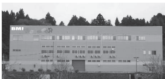
※2017年12月に坂下事業所（中間処理施設）を開設