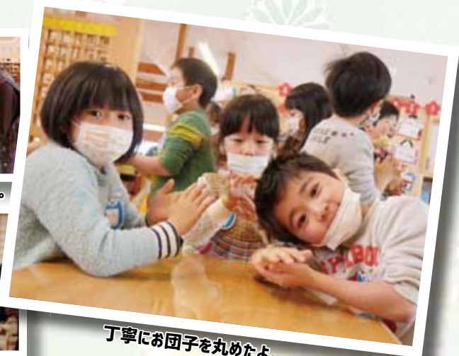
丁寧に団子を丸めたよ。