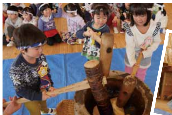
大きな杵を持って「べったん！べったん！」

坂下東幼稚園では餅つきが行われました。園児たちは順番に臼の前に立ち、カ一杯杵を下ろし餅をつきました。順番を待っている園児たちは「わっしょい！」と、餅つきをしているお友達を応援しました。 みんなでついた餅はつゆ餅、きな粉餅にしてお昼にいただきました。園児たちは柔らかい餅を美味しくいただきました。