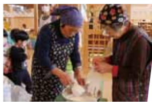
お団子の素も一緒に作りました。

坂下南幼稚園では会津の伝統行事、団子さしが行われました。子どもたちは会津坂下町老人クラブ連合会の皆さんに手ほどきを受けながら、「団子」や「ぶ」で作られた鯛や宝船などを飾りつけ、会津の伝統行事を楽しんでいました。団子をさしたミズキの木は玄関や廊下に飾りつけられました。