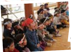
お餅つき頑張れ！「わっしょい！」