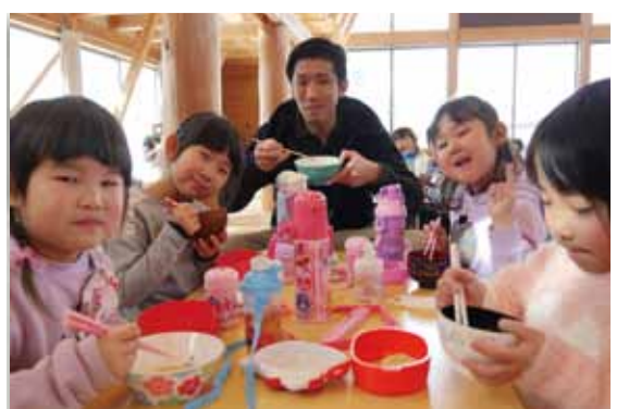
みんなでついたお餅はおいしいね！