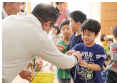
芽かきは手伝ってもらいながら、上手にできたよ。