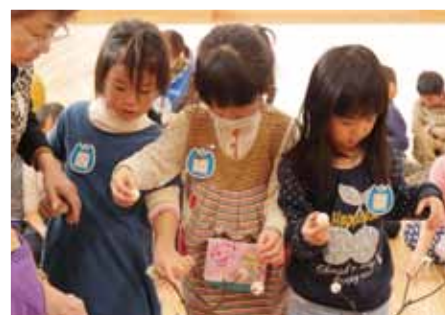
これで今年も五穀豊穡、無病息災だね！

坂下東幼稚園では餅つきが行われました。園児たちは順番に臼の前に立ち、カ一杯杵を下ろし餅をつきました。順番を待っている園児たちは「わっしょい！」と、餅つきをしているお友達を応援しました。 みんなでついた餅はつゆ餅、きな粉餅にしてお昼にいただきました。園児たちは柔らかい餅を美味しくいただきました。