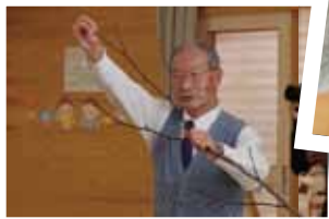
芽かきのやり方を教わりました。