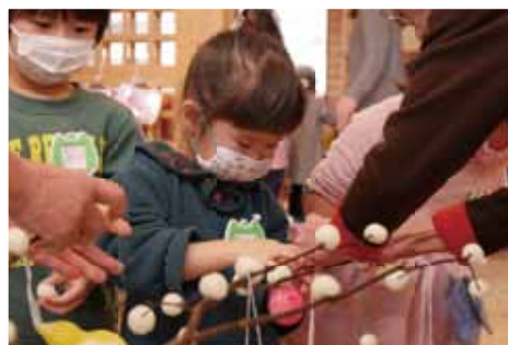
お待ちかねの団子さし！