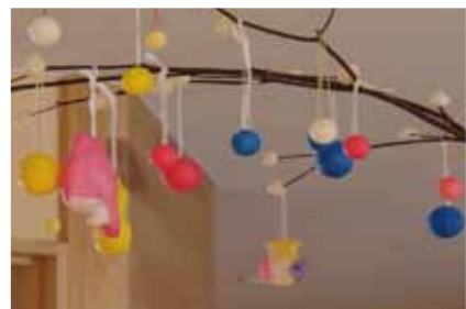
きれいに飾り付けました！！

坂下南幼稚園では会津の伝統行事、団子さしが行われました。子どもたちは会津坂下町老人クラブ連合会の皆さんに手ほどきを受けながら、「団子」や「ぶ」で作られた鯛や宝船などを飾りつけ、会津の伝統行事を楽しんでいました。団子をさしたミズキの木は玄関や廊下に飾りつけられました。