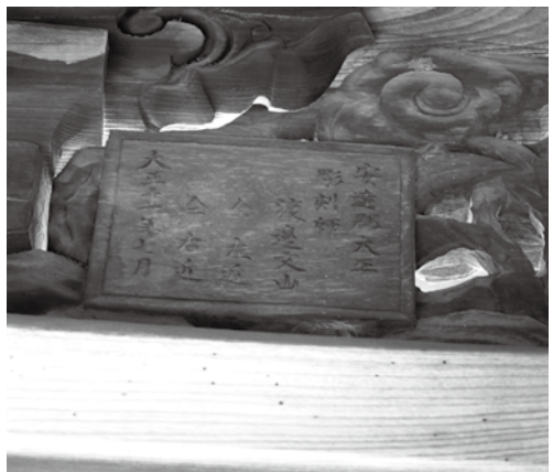
光明寺山門の銘文

門のほかにも町内には光明寺の本堂向拝(大正十五年)、光照寺本堂の欄間や太子堂、御池田の西光寺観音堂向拝(昭和二十八年)があります。