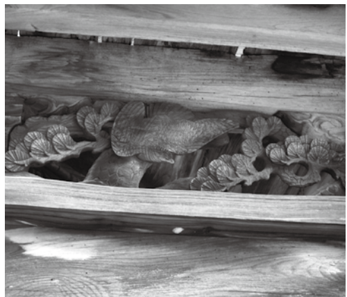
光明寺山門の彫り