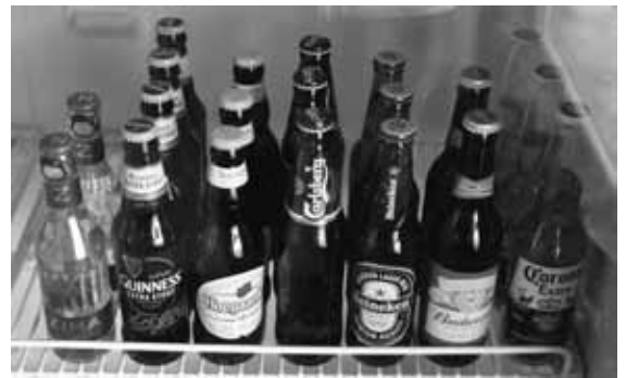
▲大人心をくすぐる、外国産の瓶ビールやリキュールたち。並んでいる姿を見ているだけでちょっと楽しくなります。

ギネスやハイネケン・ホッピーなど、ちょっと風変わりでお洒落なビールも各種取りそろえています。もちろん、アルコールだけでなく、ソフトドリンクも充実しているので、お酒が飲めない方も、一度立ち寄ってみてはいかがでしょうか？