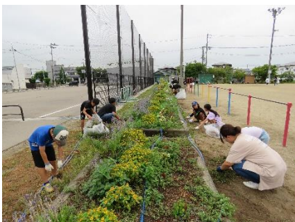
花壇の周りがきれいになりました。

19日(土)、PTA奉仕作業が行われました。3年生と5年生の保護者の皆様を中心に、希望した保護者・役員の皆様、教職員で除草と泥上げを行いました。今回は、校舎北側(町駐車場から体育館)にかけてのフェンス沿いもきれいにさせていただき、お陰様で校舎周辺がきれいになり、子ども達が気持ちよく2学期をスタートさせることができました。総務委員の皆様をはじめ、ご協力いただきました保護者の皆様、朝早くからありがとうございました。