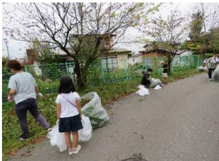
校舎北側のフェンス沿いもすっきりしました。