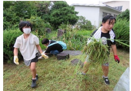
子ども達も汗を流して働きました。